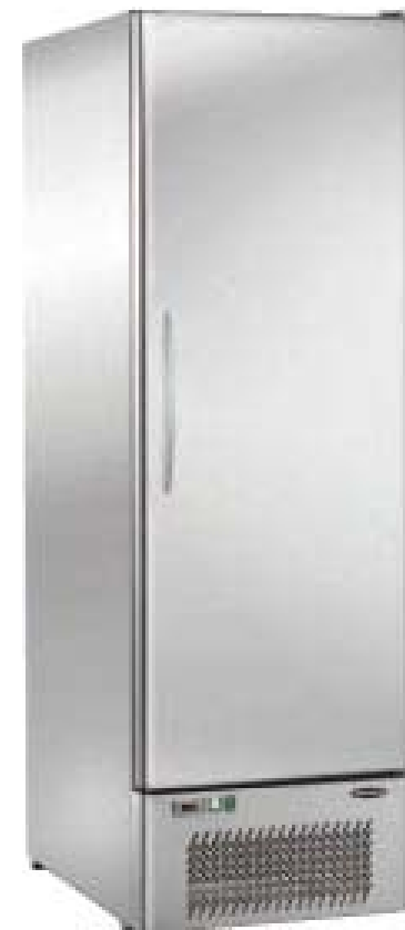
APV 034 inox

À la demande on peut avoir les versions avec alimentation 115V/60Hz ou 230V/60Hz